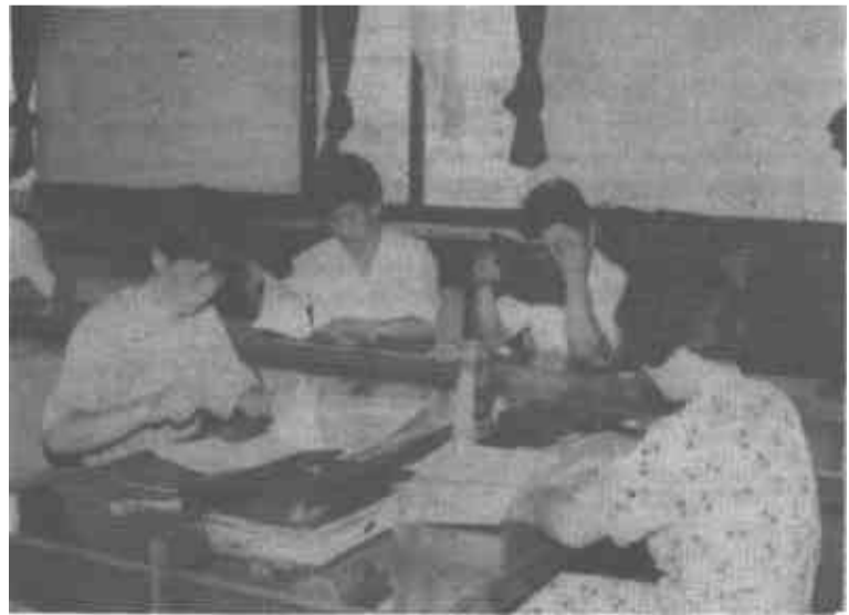
△ 图为土管内业人员在为用地单位补办手续、补发登记使用证。

答：非法交换土地是指，当事人双方违反国家法律规定，互相转移土地使用权或一方转移土地使用权，另一方转移金钱以外标的物的行为。