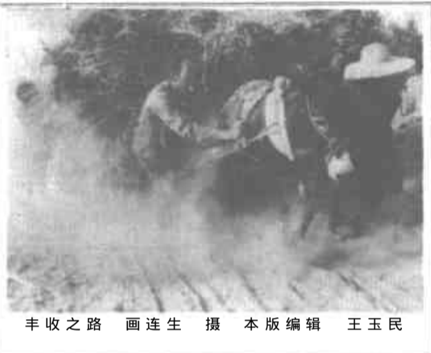
丰收之路 本版编辑 王玉民