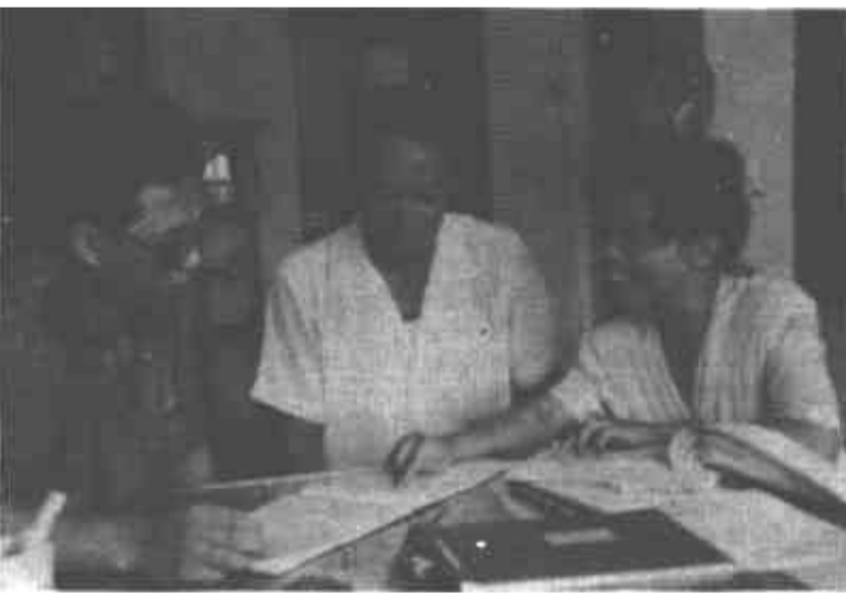
市纪委、监察局把查办违纪案件作为当前反腐败斗争的突破口。图为办案人员深入调查情况，审核账目。

本报讯 今年上半年，广饶县纪委、监察局信访室受理的案件呈下降趋势。针对这一情况，县纪委领导认真查找工作中存在的问题，采取了得力措施。县纪委、监察局及时召开了各乡镇纪委和县直部门纪检组负责人会议，认真贯彻落实中纪委二次全会精神，制定信访举报新措施。要求各级组织对群众反映的问题要高度重视，凡是反映问题属实的问题要高度负责，取信于民；对署名的信件要将调查处理结果告知信访人；要切实保护检举、举报人的合法权利；对打击报复写信、上访人的要严肃处理。由于县纪委采取的措施及时得力，仅10天的时间，信访室就受理群众来信来访13件次，涉及案件10起。（市纪委信访室）